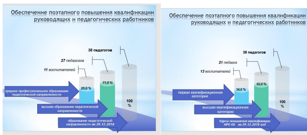
Диаграмма с характеристиками кадрового состава МБДОУ МО г.Краснодар «Центр - детский сад № 46»

В 2020 году педагоги МБДОУ МО г.Краснодар «Центр - детский сад № 46» приняли участие: