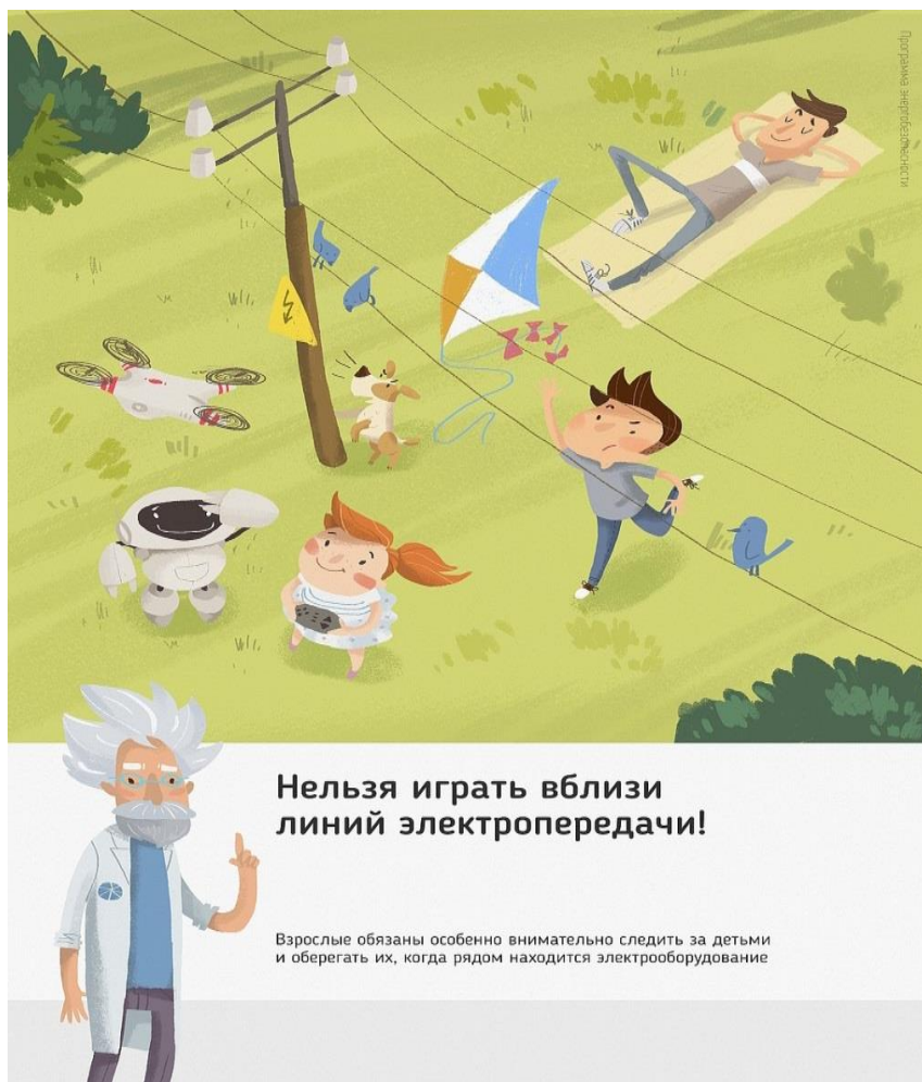
Рис.3 Нельзя играть вблизи линий электропередачи