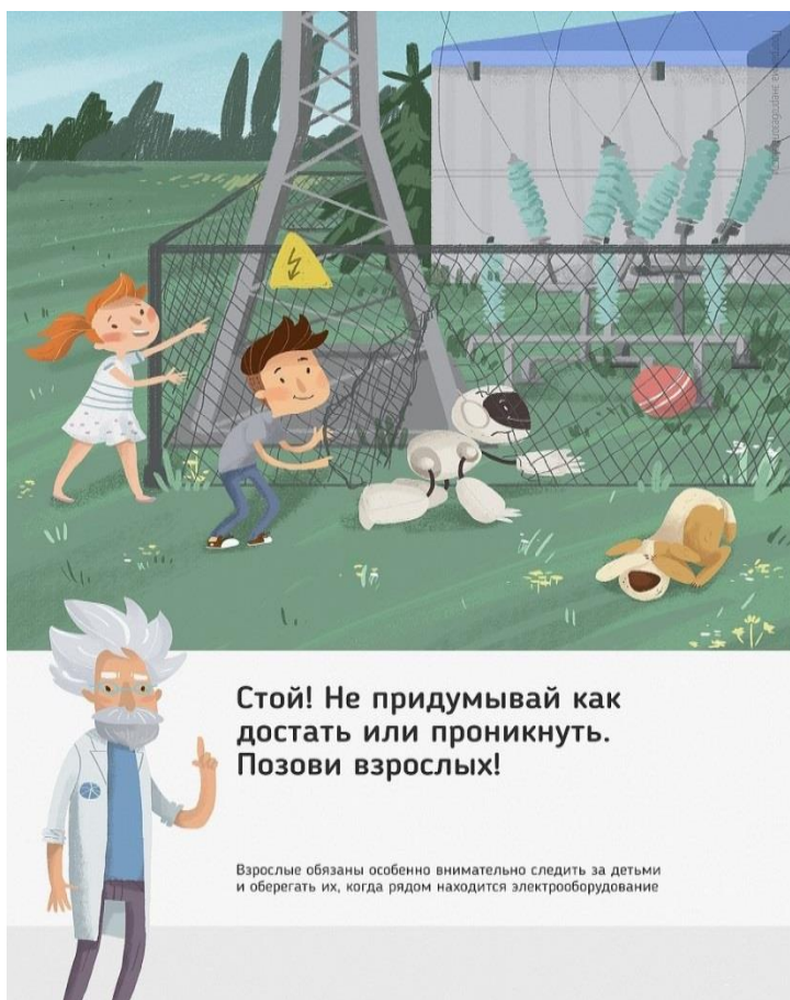
Рис. 5 Стой! Не придумывай как достать или проникнуть. Позови взрослых!