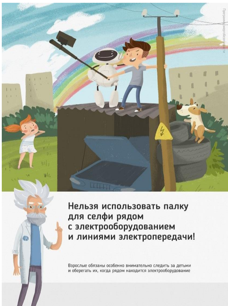
Рис 2. Нельзя использовать палку для селфи рядом с электрооборудованием и линиями электропередачи

Ну и, наконец, нужно повторить с ребенком алгоритм действий в экстремальной ситуации. Проверьте, умеет ли он набирать на сотовом телефоне телефон экстренных служб. Изучите с ним вещества и предметы, которые хорошо проводят электрический ток и потому особенно опасны, и, наоборот, вещества и предметы, плохо проводящие электрический ток и полезные в экстремальной ситуации.