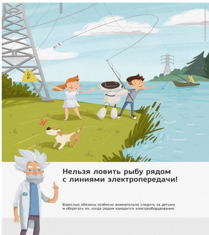
Рис. 4 Нельзя ловить рыбу рядом с линиями электропередачи

Об открытых подстанциях, оборванных проводах нужно сообщить в Кубанское ПМЭС по телефону 8-861-219-40-20 или позвонить на единый телефон всех экстренных служб 112.